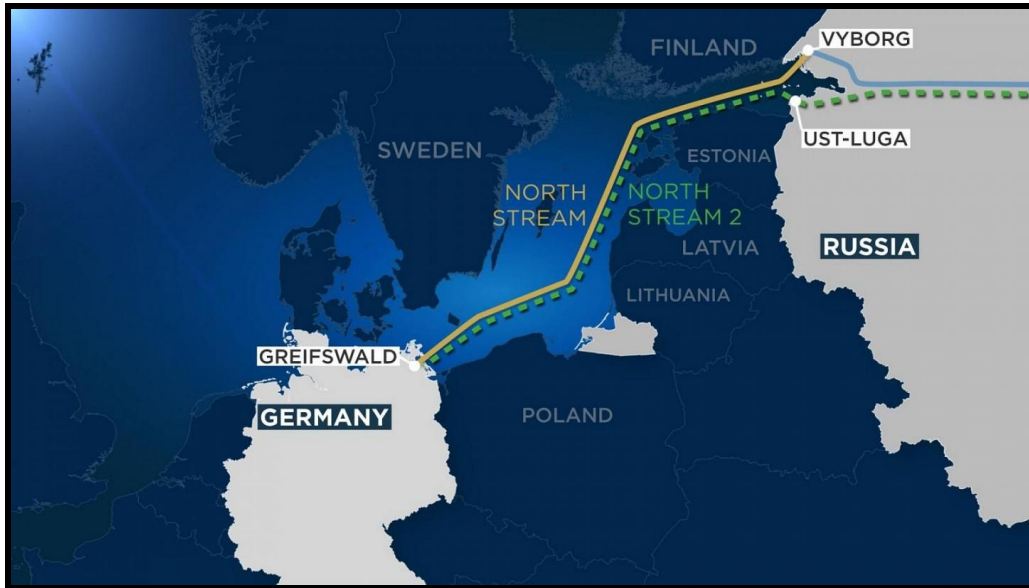
L'itinéraire de Nord Stream 2 court le long du gazoduc existant